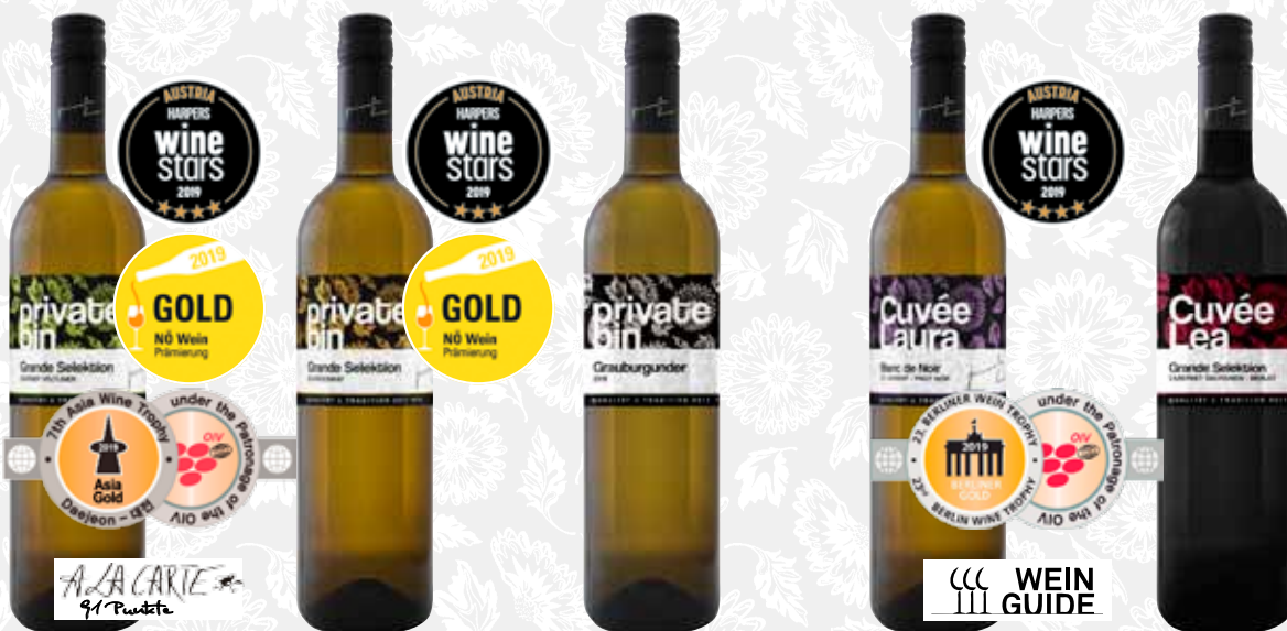
PRIVATE BIN Grande Selektion Grüner Veltliner 2017